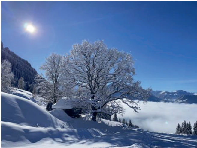
3. Dezember 2023

Die letztjährige ordentliche Generalversammlung fand am 30. November 2023 im Parkhotel, Gunten, statt. Anwesend waren 24 Aktionärinnen und Aktionäre, die insgesamt 379 Aktien und damit 43.64% des Aktienkapitals vertraten. Es wurden die ordentlichen Traktanden behandelt. Dabei erfolgte insbesondere die Genehmigung der Jahresrechnung 2022/23 und die Wiederwahl der NAVICA REVISIONS AG als Kontrollstelle.