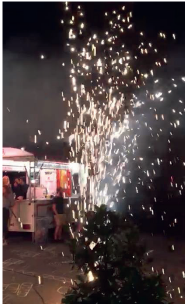
Partystimmung anlässlich des Grill-Plausch Abends am 31. Juli 2024 beim Stemmoge-Pintli